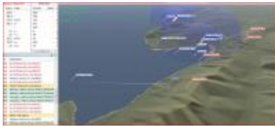
01/06/2010 17:01:08 par gillesdrone