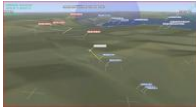
01/06/2010 17:01:20 par gillesdrone